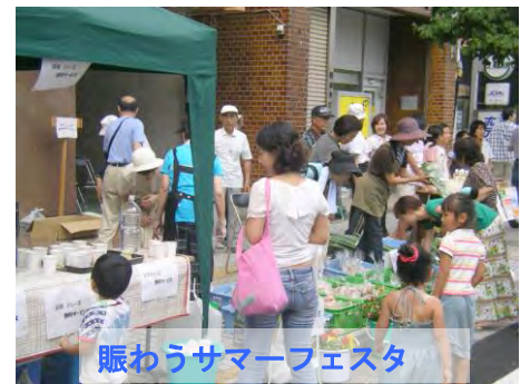
販わうサマーフェスタ