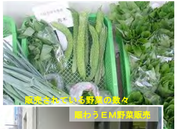
販売されている野菜の教々