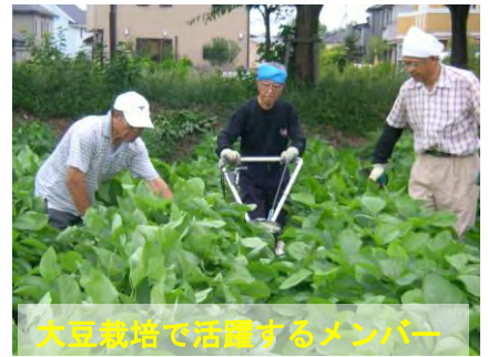
大豆栽培で活躍するメンバー

大豆栽培から味噌づくりまで、一連の体験を多くの方々と楽しもうと、今年が3年目。今までの経験を活かして、順調に栽培がすすんでいます。栽培面積は1反歩余です。