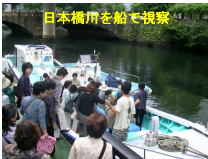
日本橋川を船で視察

当探偵団も街中に事務所(エコサロン)を移してから、毎年参加しています。今年は、大通りで例年の「野菜販売」、葉鹿エコクラブによる「EM廃油せっけん販売」、「EMしそジュースの無料サービス」、「小粒ジャガイモプレゼント」など人気を集めました。