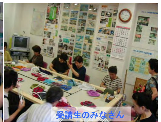
受講生のみなさん