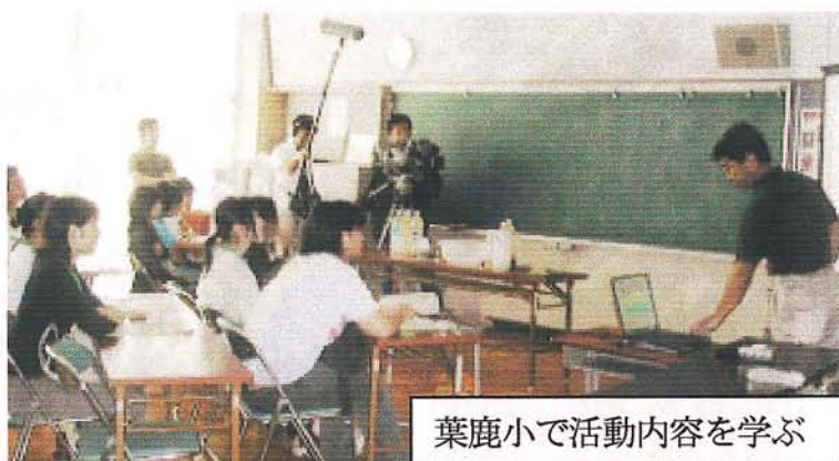
葉鹿小で活動内容を学ぶ