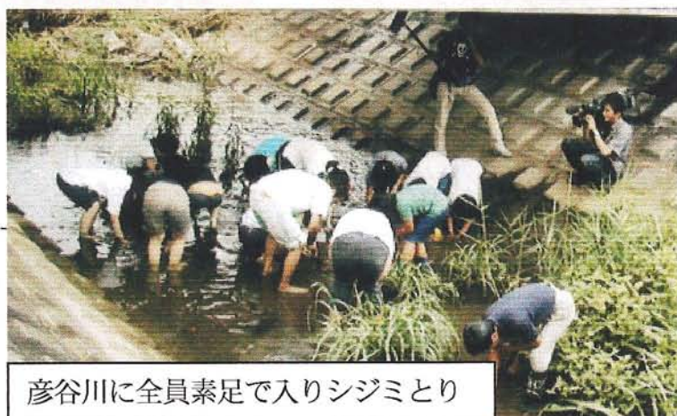
彦谷川に全員素足で入りシジミとり