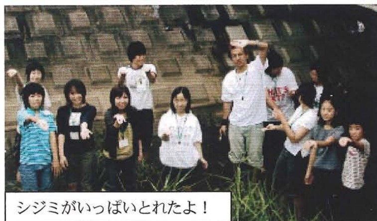
シジミがいっぱいとれたよ！

当法人はCグループを担当、葉鹿小の環境学習の実践と足利水土里探偵団の活動現場を案内した。