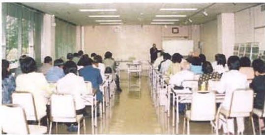
熱心に講演を聴く参加者