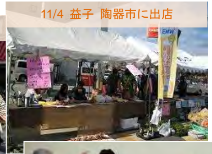
11/4 益子 陶器市に出店