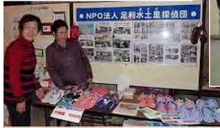
12/10 ファミリークリスマスに出店