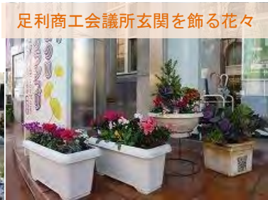
足利商工会議所玄関を飾る花々

11/15(水)、足利市の玄関ともいえる足利商工会議所 友愛会館の玄関を秋の花で飾る、花植えを当 NPO が委託されて行いました。秋から冬に向かって咲く花々を選定し、来館されるお客さまに季節を感じていただけることを念頭において、実施いたしました。いかがでしょうか。