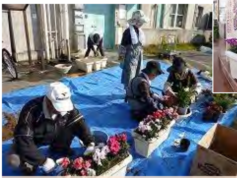
足利商工会議所駐車場で花植え作業中