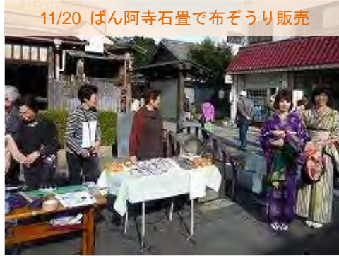
11/20 ばん阿寺石畳で布ぞうり販売