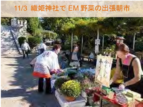
11/3 織姫神社で EM 野菜の出張朝市

11/3 (水)、足利織姫神社の秋季例大祭で恒例となった EM 野菜の販売を境内にて行いました。いつもながら、好評のうちに売切れとなってしまいました。購入された方々には、EM 野菜のおいしさを実感していただけたものと思います。